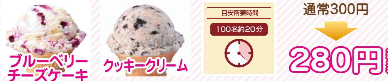
ブルーベリー チーズケーキ